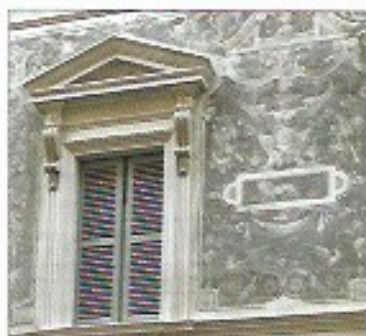
Sopra, dall'alto verso il basso Fede, Speranza e Carità : tre dipinti della seconda metà dell'Ottocento. Villn Cortellotto Concello a Rossano Veneto: il complesso è stato restaurato da Eugenio Rigoni fra il 1995 e il 2000.